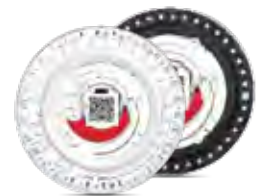
Rotor Circular de Reagentes