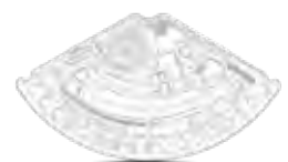
Rotor de reagente do setor